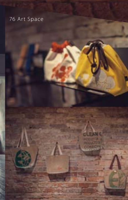
76 Art Space