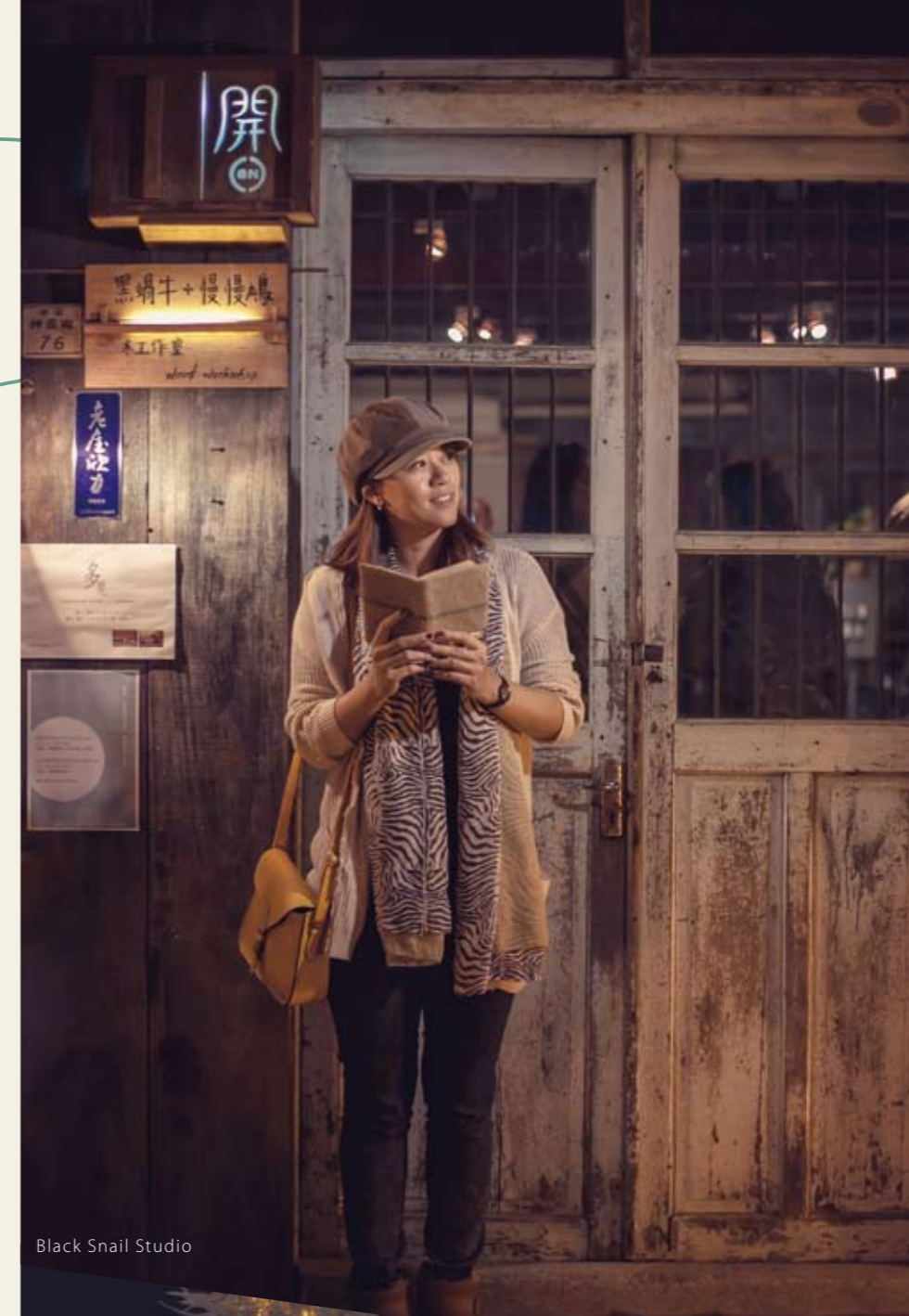
Black Snail Studio