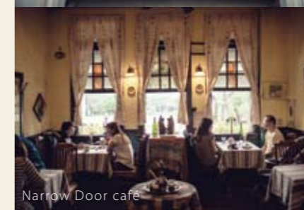
Narrow Door cafe