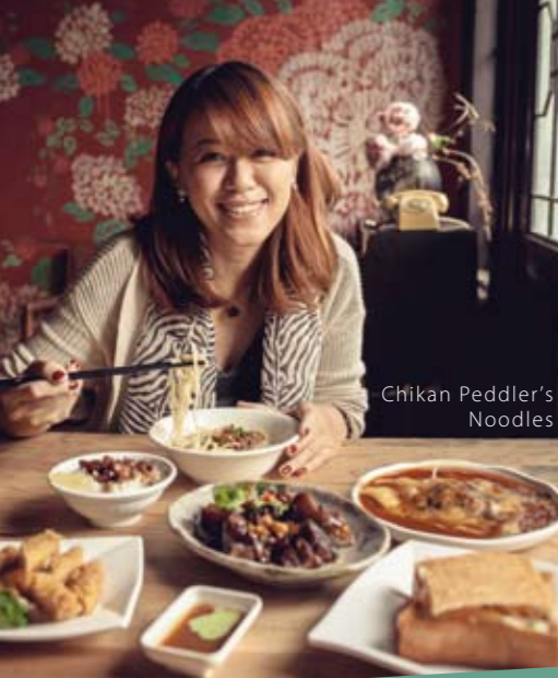
Chikan Peddler's Noodles