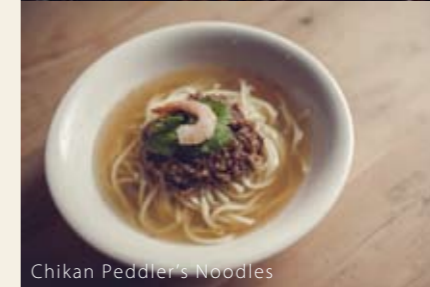
Chikan Peddler's Noodles