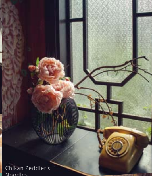
Chikan Peddler's Noodles